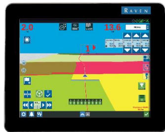
FIELD COMPUTER, CR12 063-0173-776BNT

KIT, CONSOLE, CR12, DESBLOQUEIO UT, SUPORTE INST RAM C 117-2300-001