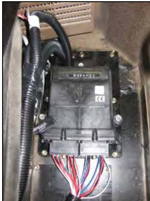
图 3. 节点安装示例