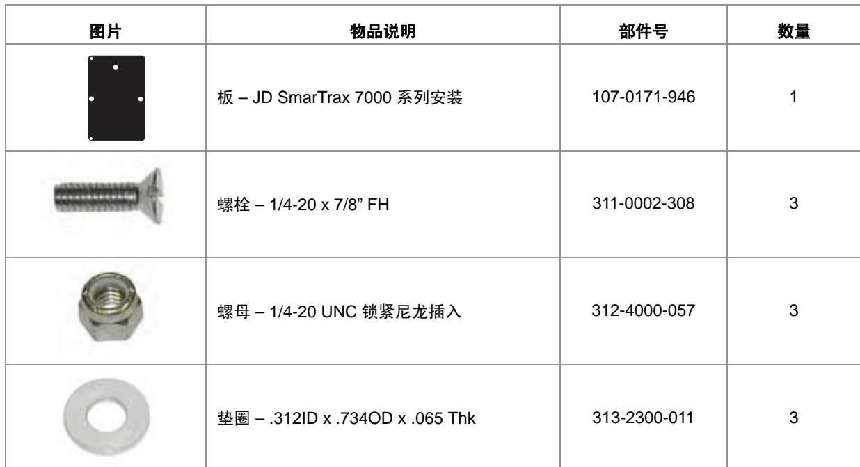
表 4. JD 7000 系列节点安装装置 (P/N 117-0197-085)