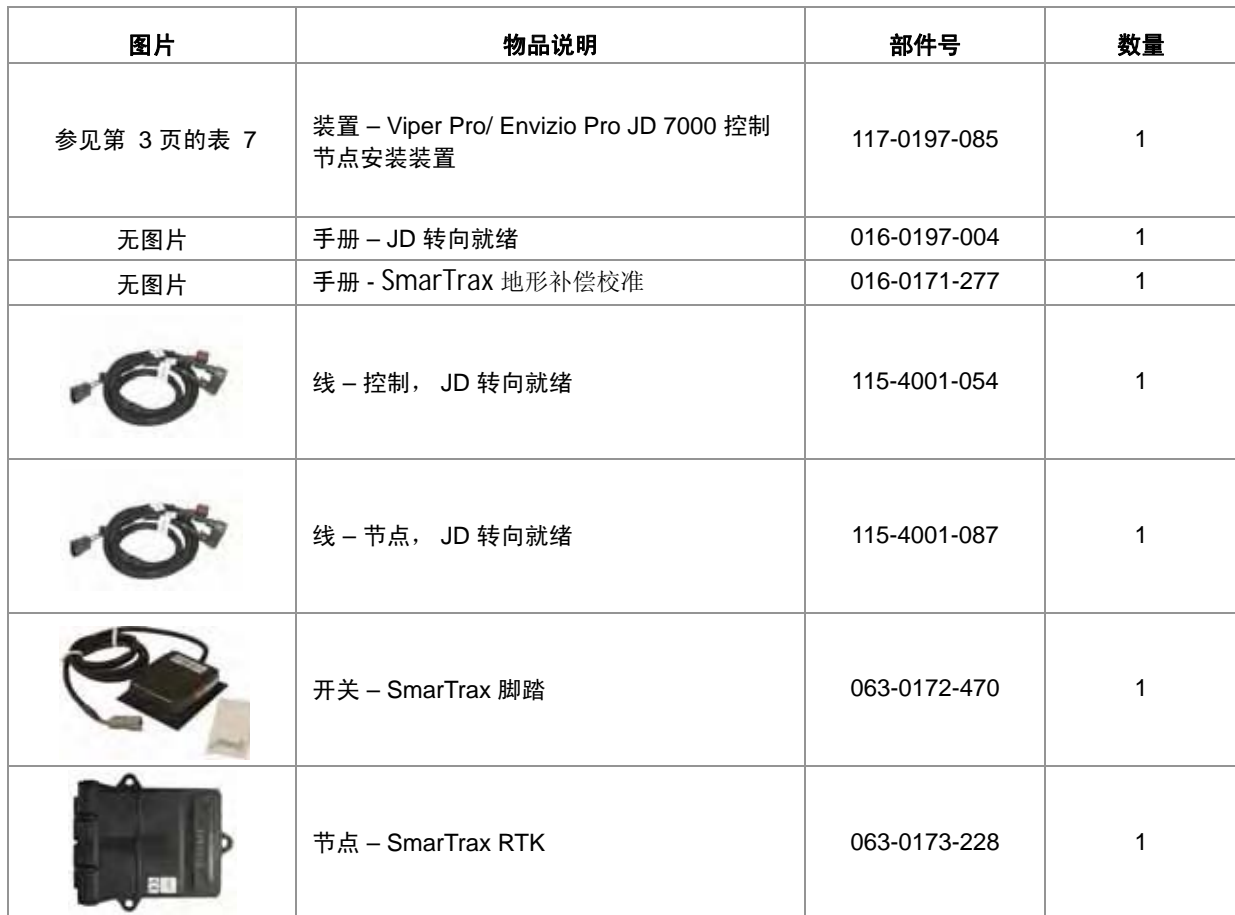
表 1. SmarTrax 3D – Viper Pro/Envizio Pro JD 7000 转向就绪安装装置 (P/N 117-4002-001)