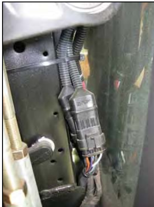
图 9. 编码器接头