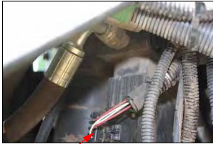
图 4. 阀接头