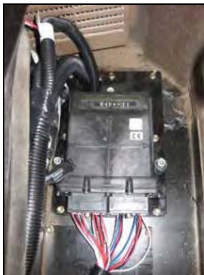
图 1. 安装板上安装的节点