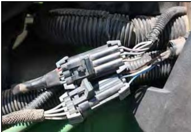
图 7. 车轮角度端子