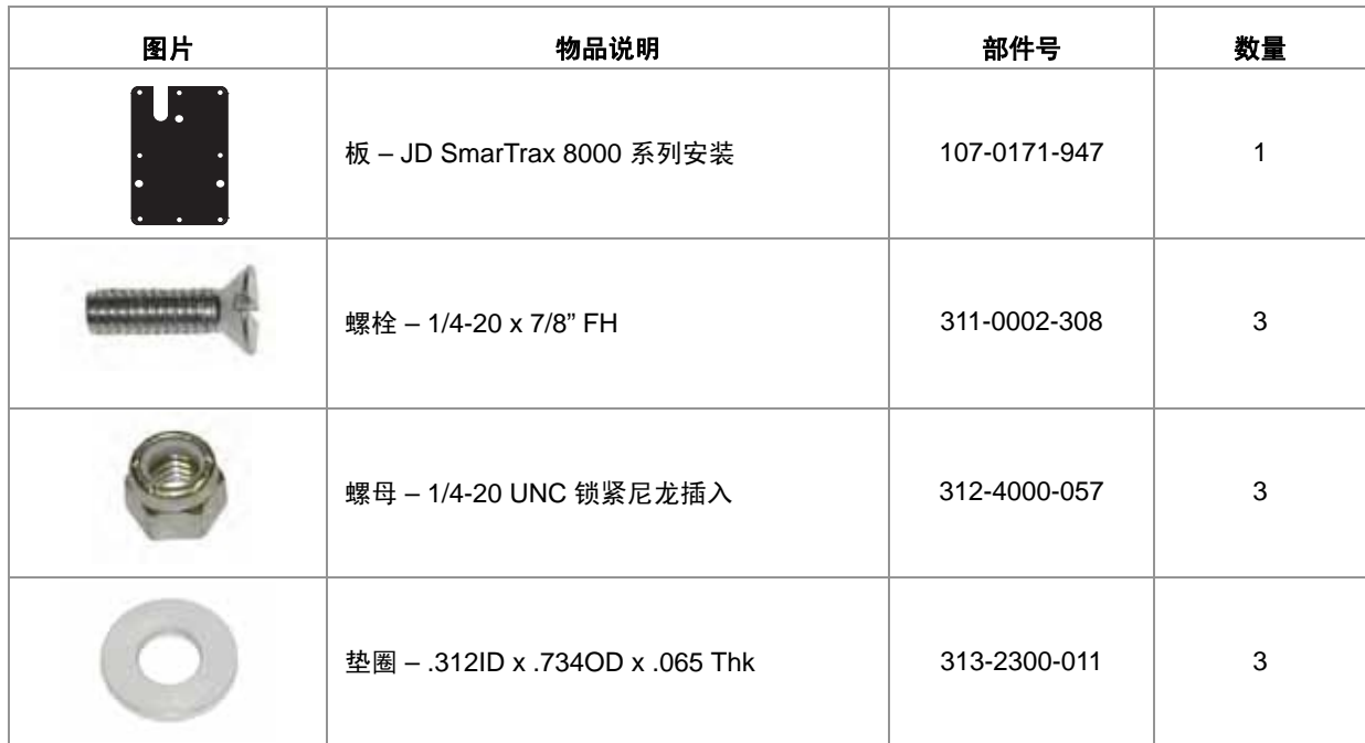
表 3. JD 8000 系列节点安装装置 (P/N 117-0197-084)