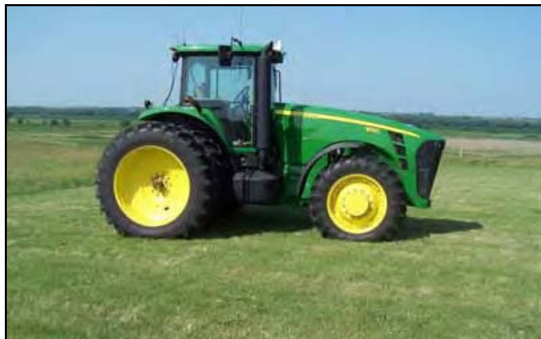
图 1. JD 8130