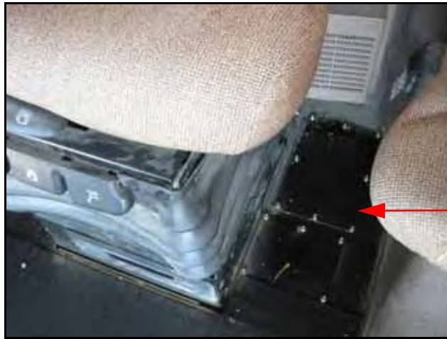
图 2. 地板面板