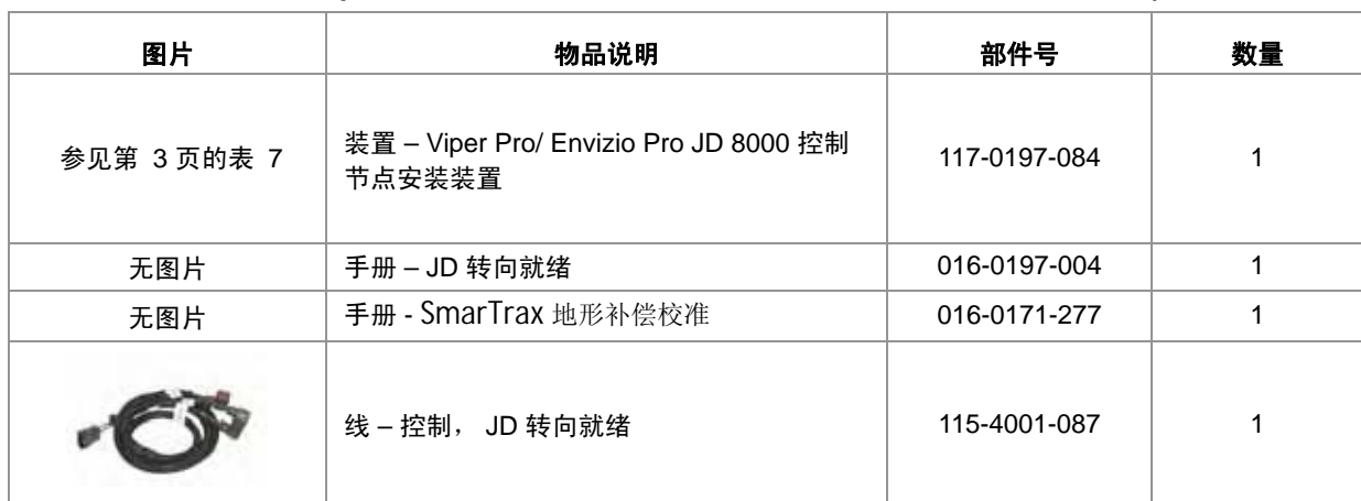
表 2. SmarTrax 3D – Viper Pro/Envizio Pro John Deere 8000 系列转向就绪安装装置 (P/N 117-4002-002)