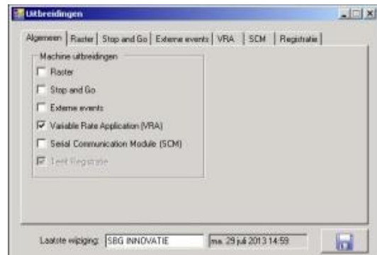
Figuur 9: VRA activeren

In SBGuidance Configurator moet VRA ingesteld worden. Open de SBGuidance Configurator van de trekker die tijdens het variabel doseren gebruikt gaat worden. Ga naar Instellingen >>> Uitbreidingen en zet een vinkje voor Variable Rate Application (VRA) (Figuur 9).