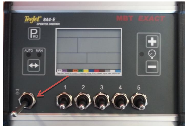
Figuur 2: Stand hoofdschakelaar

Voor de eerste instelling moet de Teejet 844-E uitgeschakeld staan met de hoofdschakelaar uit (Figuur 2).