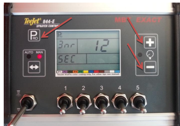
Figuur 3: Programmeermenu

Houd de “+” en “-” ingedrukt en druk vervolgens 4x op “PRO”. Hierdoor zal het programmeermenu geopend worden (Figuur 3).