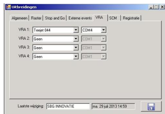
Figuur 10: VRA instellingen

Ga vervolgens naar het tabblad VRA (Figuur 10) en zet VRA 1: op Teejet 844 en gebruik COM4 . Door op de diskette te drukken worden de instellingen opgeslagen.