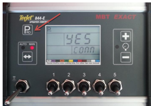
Figuur 4: Activeren communicatie poort

Druk zo meerdere keren op “PRO” totdat er rechtsonder in het scherm “CONN” komt te staan (Figuur 4). Druk vervolgens op de “+” om “NO” in “YES” te veranderen.