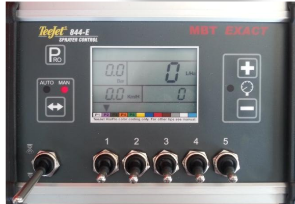
Figuur 5: Gebruikersscherm

Ga vervolgens terug naar het gebruikersscherm door 3 seconden de “PRO” in te drukken (Figuur 5).