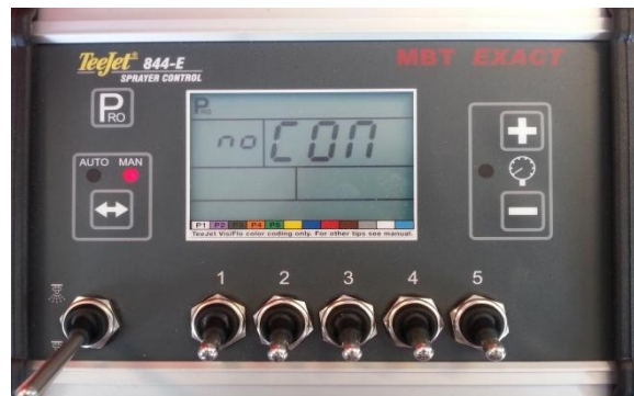
Figuur 7: Standaard communicatie scherm

Druk vervolgens meerdere keren op “PRO”. Er zal een scherm tevoorschijn komen met “NO CON” (Figuur 7). Verander deze instelling in “GPS” door meerdere keren de “+” knop in te drukken.