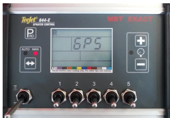
Figuur 8: Communicatie poort op GPS ingesteld

Als de communicatie op GPS ingesteld is, dan is de Teejet 844-E goed ingesteld (Figuur 8). Door vervolgens 3 seconden op “PRO” te drukken worden de instellingen opgeslagen en zal er weer naar het gebruikersscherm teruggegaan worden.