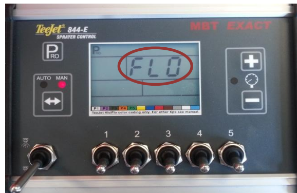
Figuur 6: Systeem programmeermenu

Houd de “+” en “-” ingedrukt en druk vervolgens 2x op “PRO”. Hierdoor wordt het programmeermenu geopend. Op het scherm is “FLO” te zien (Figuur 6).